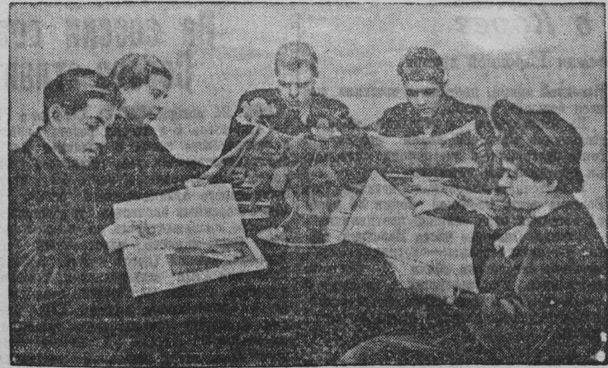
Людно по вечерам и в выходные дни в читальном зале клуба имени Дзержинского треста «Куйбышеуголь». Сюда приходят многие шахтеры гор. Сталинска.