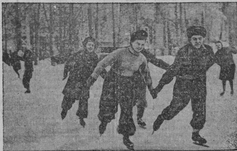
В прошлый выходной день на катке в Кемеровском городском саду. Группа конькобежцев спортивного общества «Медик».