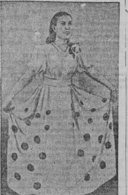
Городской смотр показал, что в ряде коллективов художественной самод-

Так, в программу коллективов хора и оркестра народных инструментов Кировского Дворца культуры, отдельных солистов, наряду со старыми русскими песнями «Белая черемуха» и «Как служил солдат», грузинской народной песни «Светлячок», альбомом из оперы Глинки «Иван Сусянин», вошли новые советские песни «Заздравная Сталину», «Боритесь за мир!», «Шахтерская застольная», «Песня о вождском богатстве».