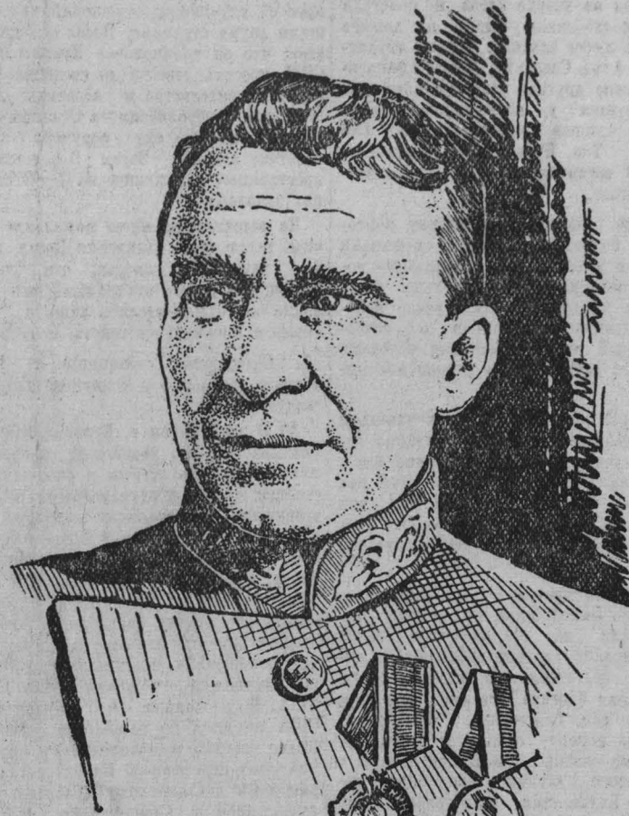
Рисунок Евг. Смирнова.

Передовики социалистического соревнования