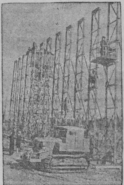
Новосибирск. Заводу строительных машин поручено изготовить для строительства Куйбышевской гидротрестации партию мачтовых подьемников.