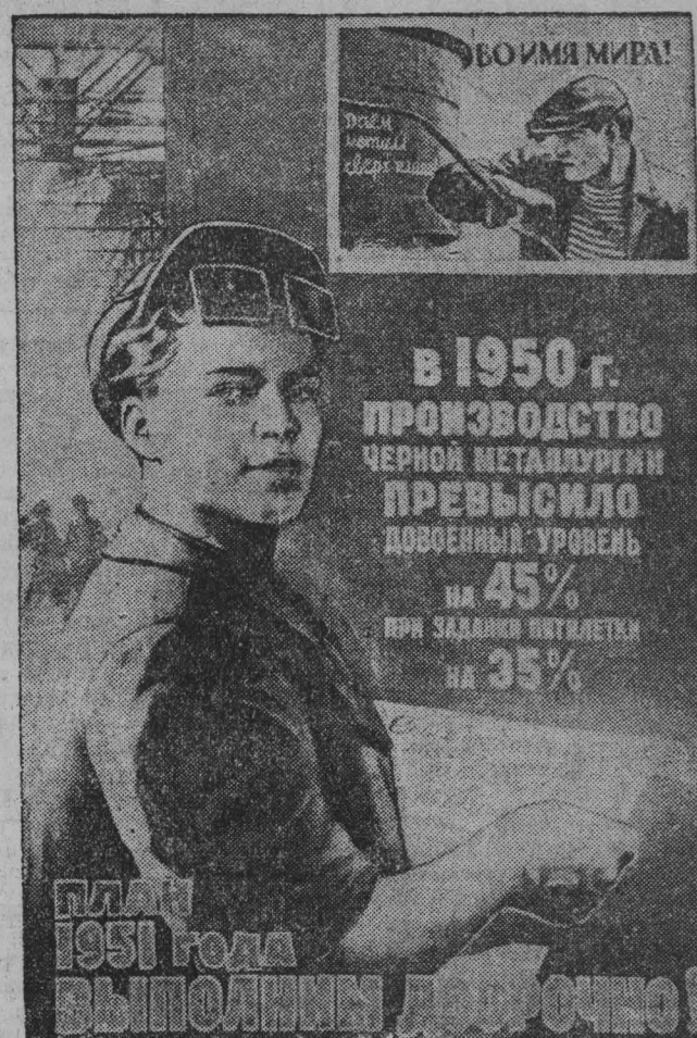
Плакат художника В. Корецкого, выпущенный издательством «Искусство».

Обсуждено и принято на собраниях рабочих, рабочих, инженеров, техников и служащих участков, цехов и отделов шахты.