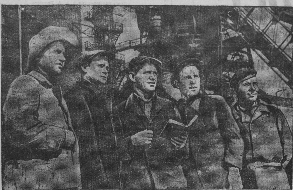
Кузнецкая сталь! Из нее для великих строек изготавливаются турбины, шагающие экскаваторы, землечерпалки, землесосы, вагоны и паровозы. Стальные балки, прокатанные в Сталинске, лягут в основу плит, станут каркасами величайших зданий волжских и Кавказской гидростанций.

Великая честь выпала на долю кузнецки! И они стараются оправдать доверие Родины, великого вождя и учителя товарища Сталина.