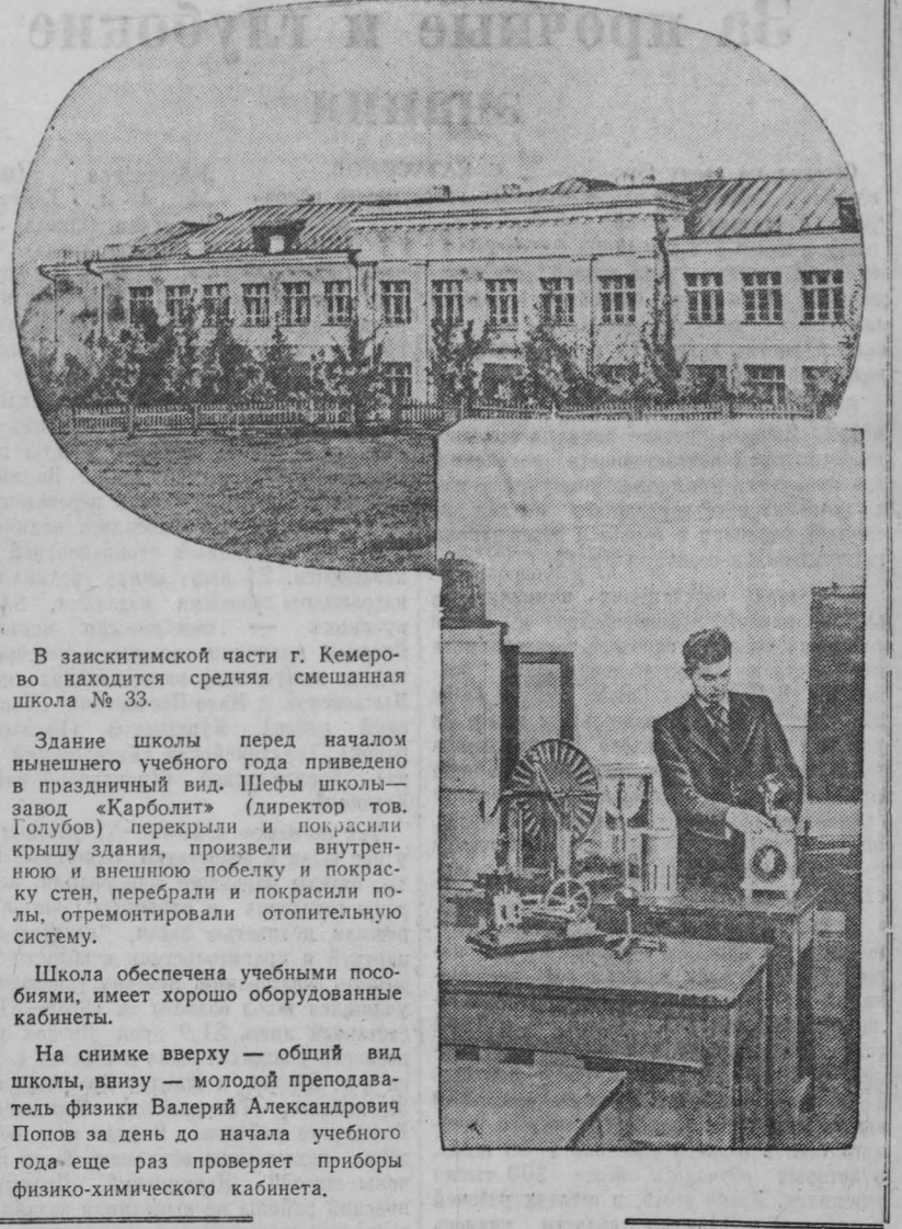
В заикитимской части г. Кемерово находится средняя смешанная школа № 33.