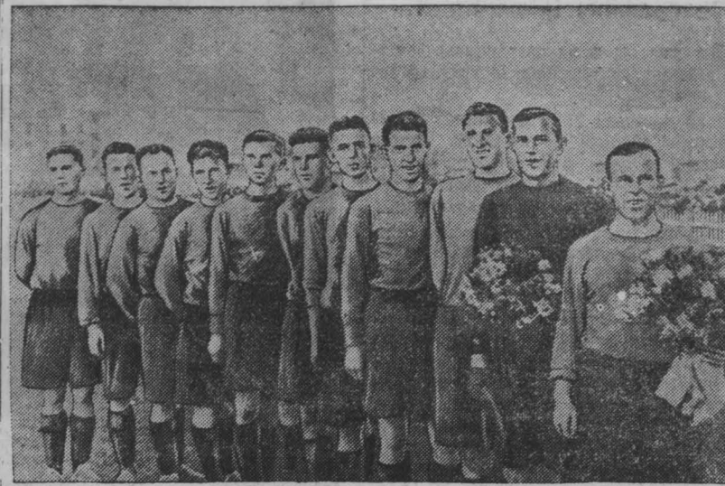
Победительница розыгрыша «Кубка ВЦСПС» по западносибирской зоне футбольная команда общества «Шахтер» (г. Кемерово).

Первые розыгрыш «Кубка ВЦСПС» состоялся в 1949 году. Тогда от Кемеровской области в зональных соревнованиях выступали футболисты «Химика». Этот молодой в то время еще не опытный коллектив проиграл новосибирскому «Локомотиву». Борьба за кубок требует от команды наиболее серьезного отношения к каждому состязанию, ибо, потерпев поражение, она выбывает из дальнейших игр.