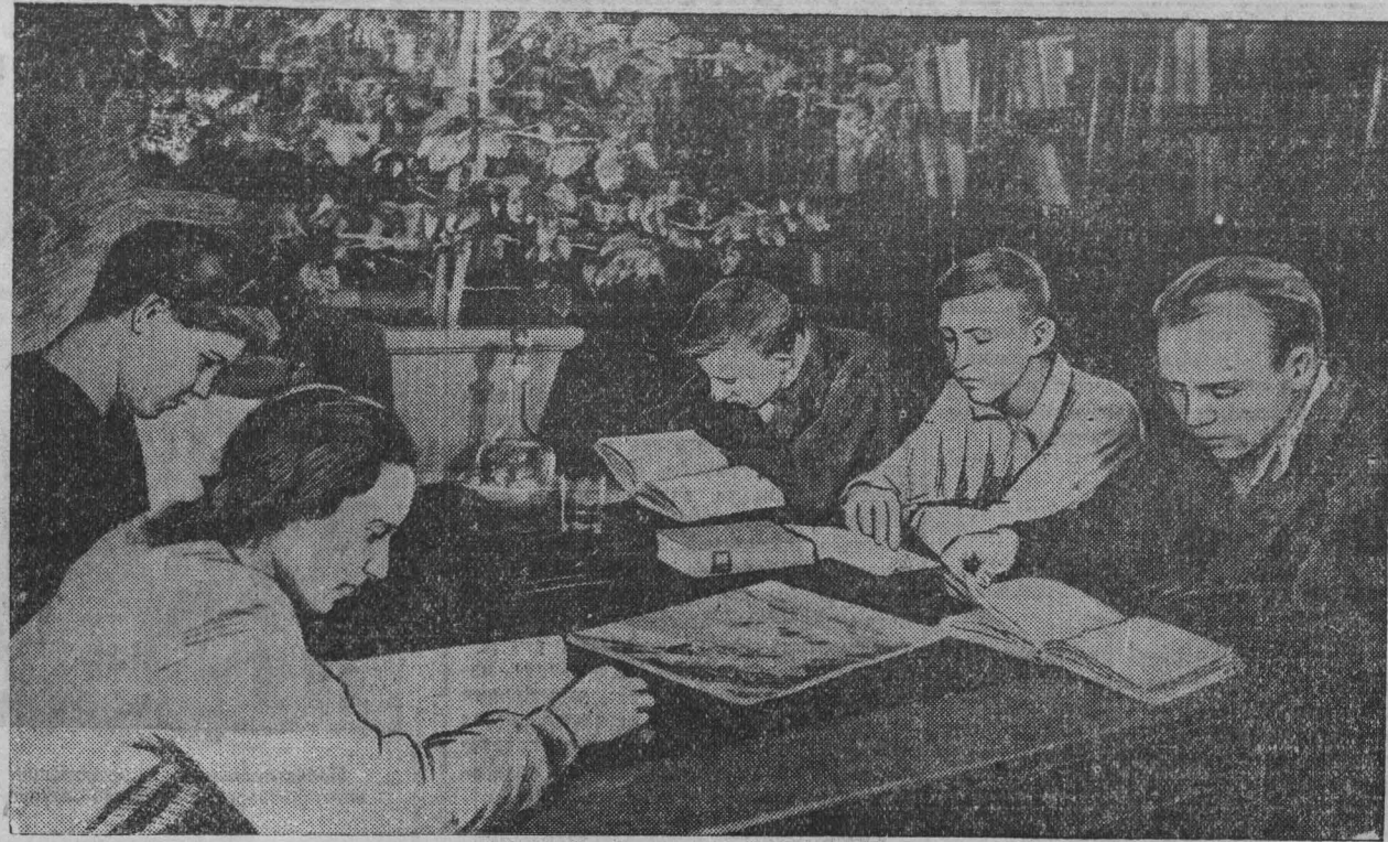
г. СТАЛИНСК. Дом техники Кузнецкого металлургического комбината имени Сталина.