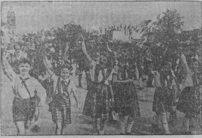
12 августа в Берлине состоялась демонстрация миролюбивой немецкой молодежи в честь «Дня молодых борцов за мир». Мимо трибуны на площади Маркса-Энгельса прошло полтора миллиона юношей и девушек.

В демонстрации приняло участие 35 тысяч юношей и девушек из Западной Германии и более десяти тысяч из Западного Берлина.