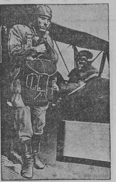
прибор должен показывать, кто из летчиков, являясь в совершенстве техникой пилотирования, в ограниченное время наберет наибольшую высоту.

На самолеты устанавливаются барографы — приборы фиксирующие высоту полета. Этот