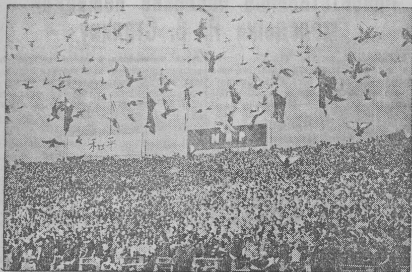
5 августа в Берлине на стадионе имени Вальтера Ульбрихта в торжественной обстановке открылся Третий Всемирный фестиваль молодежи и студентов в защиту мира.