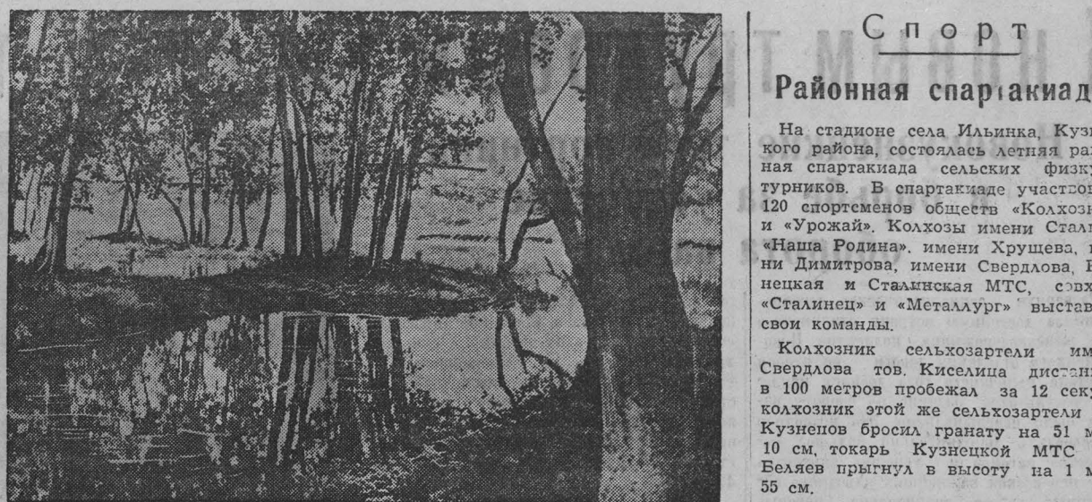
Окрестности Сталинска. Тополевая роща.

Схоронить продукты легче, чем сохранить их. Пока в магазине № 17 справлялись с сырками, заведующие магазином № 31 горпещеторга