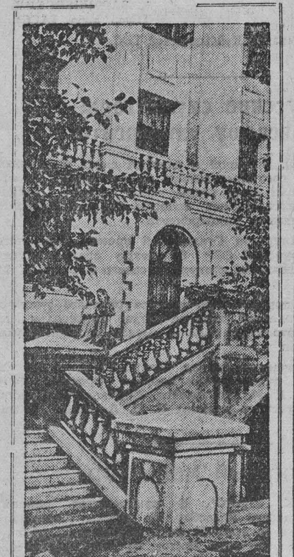
ГОР. ПРОКОПЬЕВСК. Центральный вход в общежитие молодых горняков шахты имени Сталина на Фасадной улице.