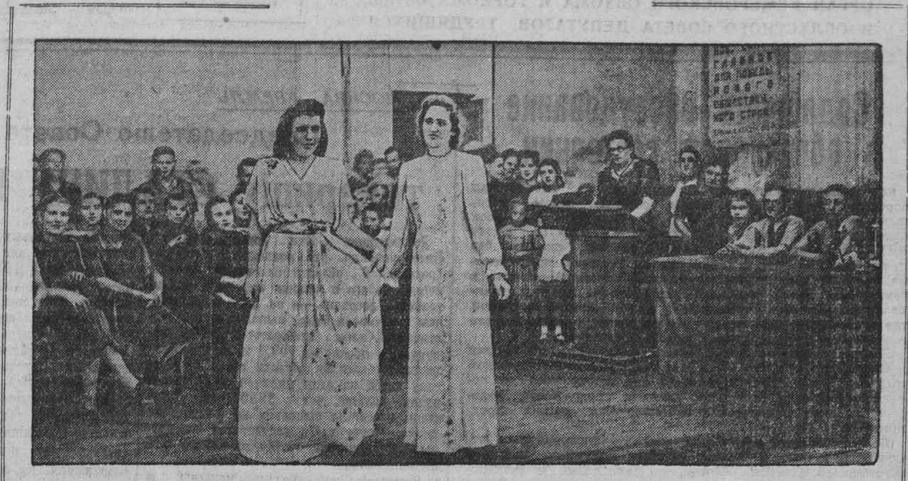
На областном смотре образцов одежды и обуви в клубе Кемеровского коксохимического завода.

«При обсуждении в американском сенате законопроекта о жилищном строительстве было официально заявлено, что одна из каждых пяти семей городского населения США живет в грязных трущобах. Даже в кварталах, расположенных у самого сената, тысячи людей ютятся в лачугах без освещения и отопления, готовят пищу под открытым небом. Корреспондент газеты «Сен» после посещения трущоб Нью-Йорка заявил: «Я потрясен жилищными условиями людей. Я видел здесь жилища, в которых крысы грызут детей в колыбельках и наносят детям такие раны, что их приходится отвозить в больницу.»