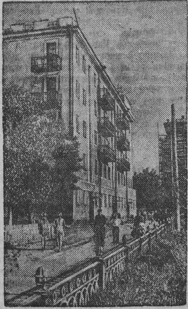
Гор. СТАЛИНСК. На проспекте им. С. М. Кирова.