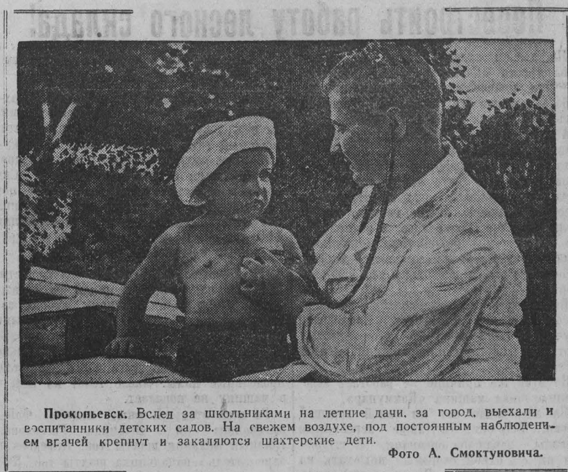
Прокопьевск. Вслед за школьниками на летние дачи, за город, выехали и воспитанники детских садов. На свежем воздухе, под постоянным наблюдением владыч кренют и закаляются шахтерские дети.

ВАРШАВА, 24 июля. (ТАСС). Вчера военный суд в Варшаве приговорил гитлеровских военных преступников генерал-лейтенанта СС и полковника Юргена Штрона и капитана СС Франца Конрада к смертной казни.