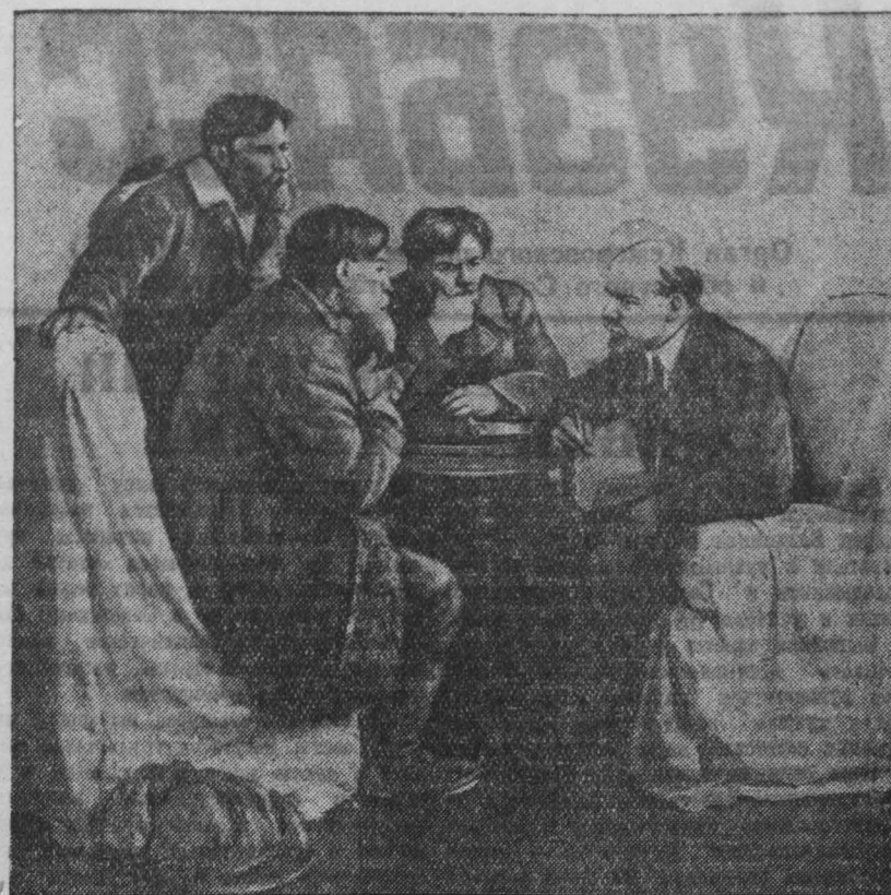
«Ходяки у В. И. Ленина». Картина художника В. А. Серова. (Всесоюзная художественная выставка 1950 г.)