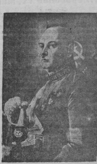
Сегодня, 24 июня, исполняется 70 лет со дня рождения Григория Ивановича Котовского, героя гражданской войны. Г. И. Котовский родился в 1881 году. Он был убит врагами народа в 1925 году.

КИЕВ. (ТАСС). Украинский народ чтит память замечательного патриота нашей Родины Григория Ивановича Котовского. Его именем в республике названы улицы, площади, колхозы, клубы, библиотеки, учебные заведения.