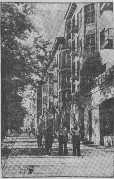
Город СТАЛИНСК. Новые дома по проспекту имени Молотова.

своих дворов, — говорит тов. Цибулевский. — Емкость этих ям составит по 200—300 тонн вместо обычных 20—30 тонн. Они будут обложены изнутри и покрыты крышей. Механизаторы преявили справедливые претензии к управлению сельскохозяйственной пропаганды областного управления сельского хозяйства, которое не обобщает и не распространяет опыта работы МТС. Областное управление сельского хозяйства, — сказал директор Худяшевской МТС тов. Банников, — не распространяет передовой опыт и рационализаторские мероприятия наших МТС. О реальных успехах, применяемых в Судженской МТС, о практике вытравившей трамшей в Черкасовской МТС никто из нас не знает. Участники совещания заслушали также доклад главного агронома областного управления сельского хозяйства тов. Пиневича об агротехнике получения высокого урожая кормовых корнеплодов.