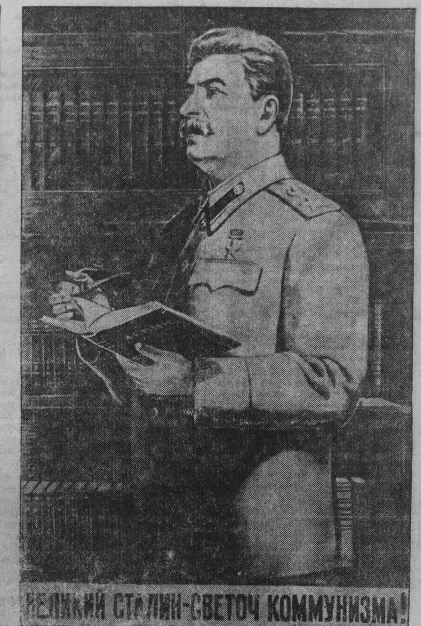
ВЕЛИКИЙ СТАЛИН—СВЕТОЧ КОММУНИЗМА!

С каждым днем все величественнее и все сильнее становится наша родная Москва. Со сложной быстротой вырастают на ее улицах новые здания, расцветают новые скверы и бульвары, ширятся и украшаются площади.