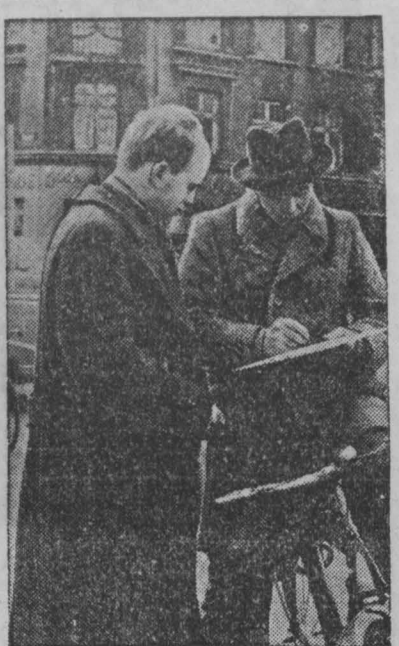
В Дании проходит сбор подписей под Обращением Всемирного Совета Мира о заключении Пакта Мира между пятью великими державами. Странники мира призывают всех датчан своей подписью внести вклад в дело упрочения мира. Сбор подписей производится на предприятиях, в домах, на улицах. НА СНИМКЕ: сторонники мира в Копенгагене собирают подписи под Обращением Всемирного Совета Мира.