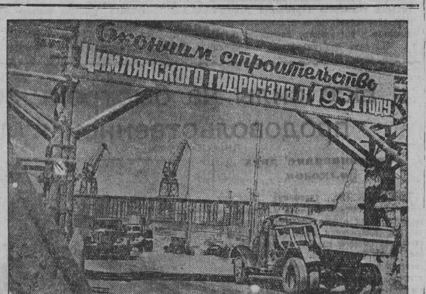
Одним из основных сооружений Волго-Донского канала является Цимлянский гидроузел. Он будет состоять из двух плотин и гидростанции. НА СНИМКЕ: под'езд к котловану строящегося Цимлянского ГЭС.

Сессия одобрила опыт работы коллектива животноводов молочно-товарной фермы колхоза имени Калинин и решила распространить его на другие фермы. Намечены мероприятия по улучшению ветеринарного обслуживания животноводческих ферм летом.