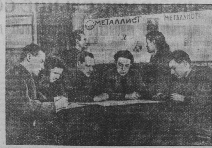
На Прокопьевском механическом заводе регулярно, дважды в месяц, выходит стенная газета «Металлист». В этой стенгазете широко освещаются работа и учеба большого коллектива завода. Газета правильно подмечает недостатки и помогает их исправлять. НА СНИМКЕ: редколлегия стенгазеты «Металлист» за выпуском очередного номера.

Большевистская печать высоко несет знамя великих идей Ленина — Сталина! Н. ЛОГИНОВ.