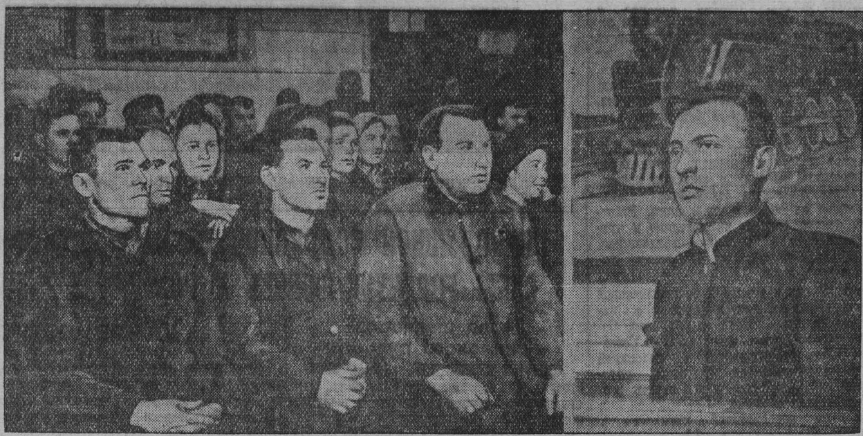
Прислушав по радио постановление Народного Коммунистического завода подорожники стали на стахановскую НА СНИМКЕ: выступает на митинге