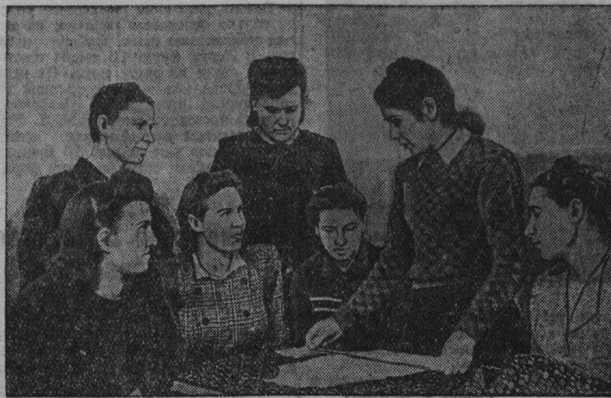
В школе кройки и шитья Дворца металлургов (г. Сталино) занимается много рабочих и служащих комбината имени Сталина. 47 учащихся этой школы после шестимесячной учебы сейчас готовятся к выпускным экзаменам. На снимке: группа выпускников школы на практических занятиях по раскрою дамского платья.