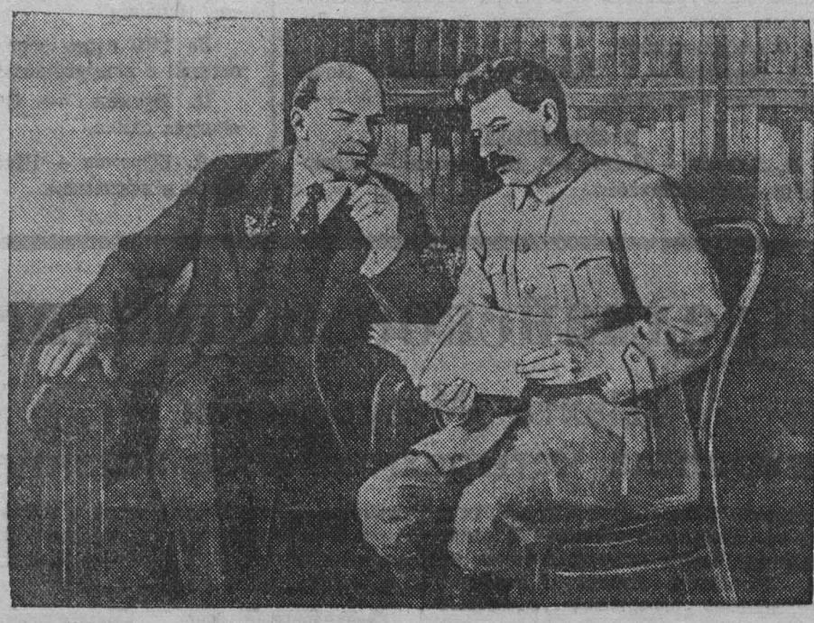
В. И. Ленин и И. В. Сталин.

Создано прочное многонациональное государство, являющееся образцом справедливого разрешения национального вопроса. В результате осуществления ленинско-сталинской национальной политики, на основе победы социализма в СССР созданы новые, социалистические нации, гораздо