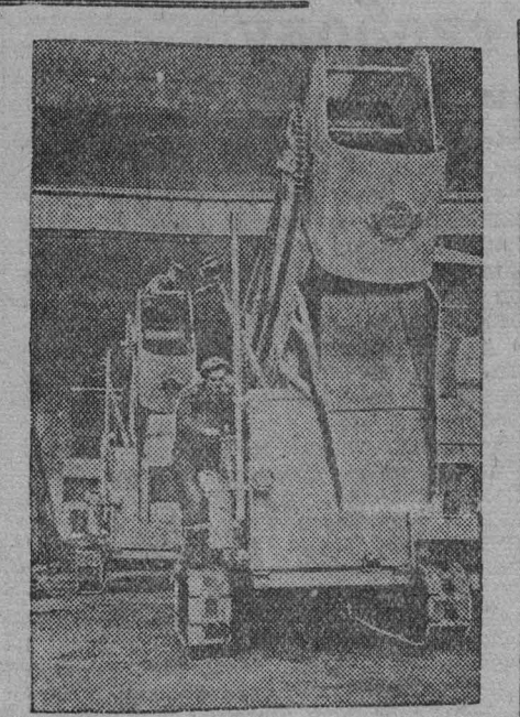
Брянская область. Завод дорожных машин освоил серийный выпуск самоходных аэрационных погрузчиков Т-61, предназначенных для погрузки сыпучих материалов (песка, гравия, угля, торфа). Погрузчики широко применяются на строительстве дорог. Производительность новой машины — свыше 100 кубометров в час. На снимке: сборка самоходных погрузчиков на заводе.

ИВАНОВО, 10 апреля. (ТАСС). Сегодня от платформ выходной базы «Главентильсбыта» отошел специальный поезд. Это — скоростной маршрут. Он доставит 5 миллионов метров тканей весенне-летних сортов в Азербайджан, Армению и Грузию. Весенне-летние сорта материй в по-