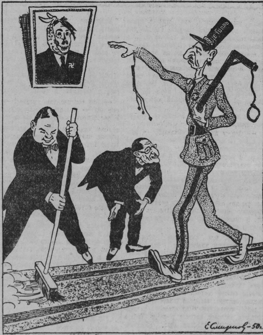
Рисунок Е. Смирнова.

Правые социалисты всегда и всюду расчищали дорогу фашизму. Так было в Германии, так было в Австрии, так было и во Франции перед первой мировой войной. Так происходит во Франции в настоящее время, где правые социалисты расчищают путь реакции. (Из газет).