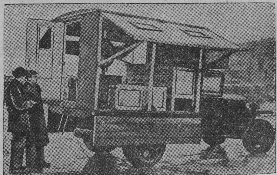
Московский завод «Запчасть» Министерства совхозов СССР отгрузил партию передовых ремонтных мастерских для совхозов Молдавской ССР, Горьковской, Тамбовской, Омской и ряда других областей. Мастерские смонтированы на шасси автомобиля ГАЗ-АА в виде фургона. В каждой из них имеются сверлильный станок, походный горн, набор слесарного инструмента. На снимке: передвижная ремонтная мастерская в рабочем положении.

Книга выпущена Государственным издательством политической литературы в тиражом в полмиллиона экземпляров. (ТАСС).