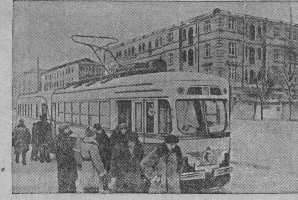
Горд Кемерово. На стройках большое оживление. За зиму вырос новый квартал жилых домов по Советской улице. Сейчас развернуто работы на новых строительных площадках.

е гордостью показывал нам первый, построенный силами таштагольцев, пневматический подъемник. Подъемник захватывает пустую вагонетку за рамку и ставит ее в ряд с рельсовым путем. Пока электродвигатель нагруженный вагончик, пустой вагончик поднимается по рельсам, ставится на рельсы и подается для загрузки, которая производится, таким образом, непрерывно. Появление на руднике буровых кареток и высокопроизводительных погруженных машин ПМ-5 дает реальную возможность увеличения проходки до 100 и более метров в месяц. Это в два с половиной раза больше прежнего. Не так давно работает тов. Федосев на своей каретке, а уже полумывает о том, как заветить работать ее производительно. Он находит, например, что каретка много выиграла бы в своей подвижности и маневренности, если бы была на тусовочном ходу. Старый горняк бодро смотрит в будущее. — Кто работал на колонке, на дифтерах, тот будет работать и на каретке! — говорит Федосев. — Но, конечно, от всяких привычек придется отказаться. Варварское отношение машины к себе не потерпит. Машину надо любить!.. Старый горняк думает и над задачами коллектива. — Руда Горной Шории нужна стране! — говорит он. — Значит, сил для этого не пожалеем, а руду дадим! И не только сил не пожалеем, но и силками свою работу. «Давно уже окончился трудовой день и опустился над Таштаголом ночь. Но Федосев еще долго после смены сидит с молодостью в мажорной комнате участка, рассказывая ей о своей новой каретке...» Таштагол. И. АРАЛИЧЕВ.