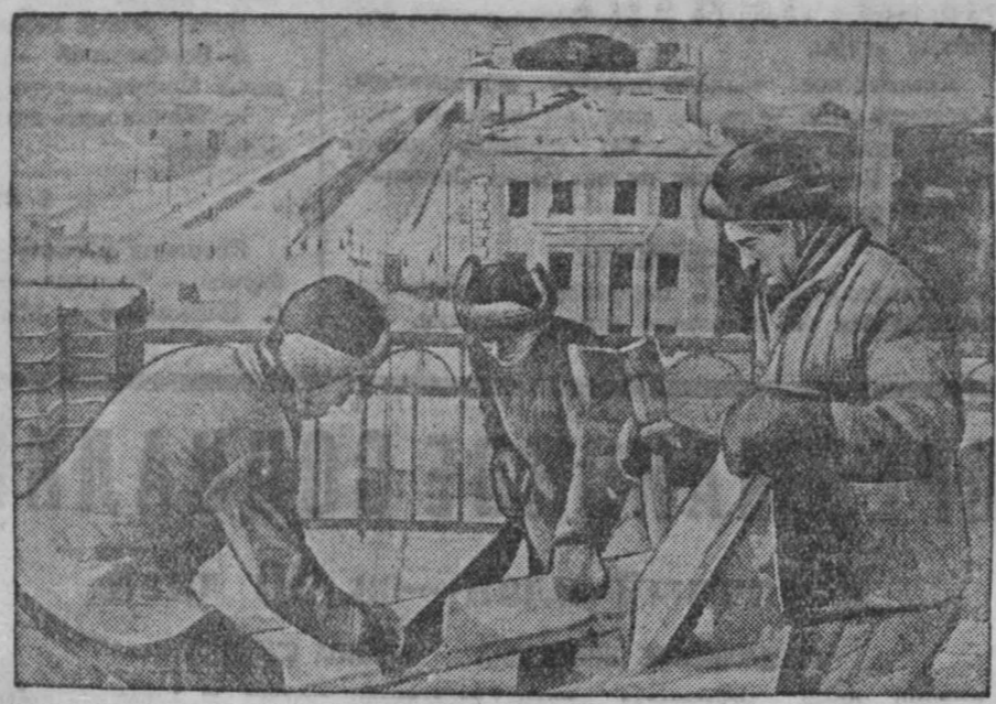
Гор. Кемерово. Строители треста «Кемжестрой» на постройке жилого дома по ул. Советской.