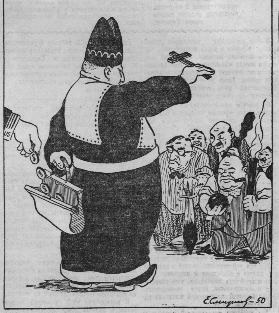
Рис. Евг. Смирнова.

17 марта Пий XII дал указание развернуть кампанию за безоговорочную поддержку агрессивной американской политики. Так папский престол послужил империалистическим поджигателям войны к новому мрачному злодейству против трудящихся. (Из газет).