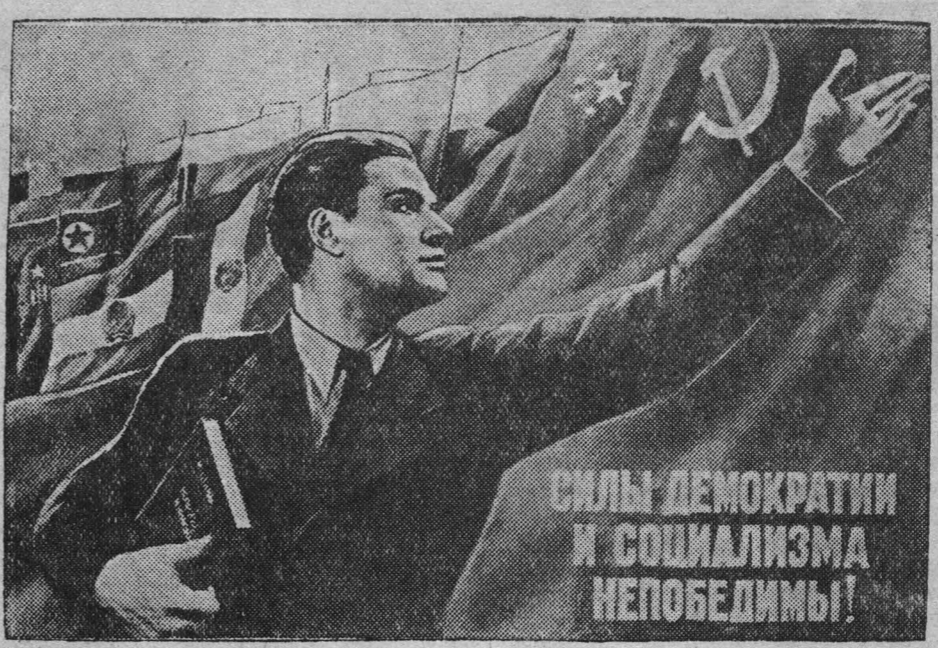
Плакат работы художника В. Коренко. (Издательство «Искусство»).

Комиссия, принимавшая машины, дала высокую оценку ремонтным работам.