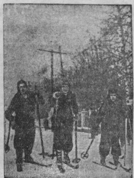
На лыжной прогулке.

ПАРИЖ, 2 января. (ТАСС). Движение протеста французских трудящихся против производства и переброски военных материалов, предназначенных для ведения колониальной войны во Вьетнаме, принимает широкую форму. По сообщению газет, сварщики крупнейшего паровозостроительного завода, находящегося в городе Фив-Лилль (департамент Нор), постановили прекратить работу, связанные с производством паровозов, предназначенных для Индо-Китая. В принятой на общем собрании резолюции сварщики обращаются ко всем рабочим гор. Фив-Лилль с призывом прекратить работу по сборке и отправке паровозов в Индо-Китай. Клепальщики завода поддержали призыв сварщиков. Коллектив железнодорожного депо города Сотралье Руан (департамент Нижняя Сена) обвинил получасовую забастовку в знак протеста против войны во Вьетнаме и против плана сформировать французской железнодорожной сети, представляющего увеличение большого числа железнодорожников. В принятой резолюции железнодорожники заявляют о своем решении «всеми мерами воспрепятствовать перевозкам военных материалов, доставляемых американцами». На своем собрании в здании биржи труда в Нанте (департамент Нижняя Луара), профсоюз моряков и докеров эндогласно постановили отказаться от разгрузки, погрузки и перевозок военных материалов.