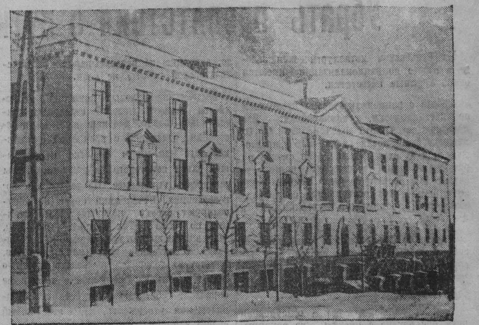
В одном из новых зданий на Фасадной улице в Прокопьевске оборудовано благоустроенное общежитие молодых рабочих шахты имени Сталина.

НЬЮ-ЙОРК, 25 декабря. (ТАСС). По сообщению сеульского корреспондента агентства Ассошиэтед Пресс, Ли Сан Ман отдал приказ о том, чтобы «второстепенные правительственные учреждения» покинули Сеул. Так называемое Национальное собрание эвакуировано в неуказанный порт на южном побережье Кореи. Ли Сан Ман заявил, что «американские друзья» посоветовали ему «разрешить эвакуацию» для удобства ведения военных операций.