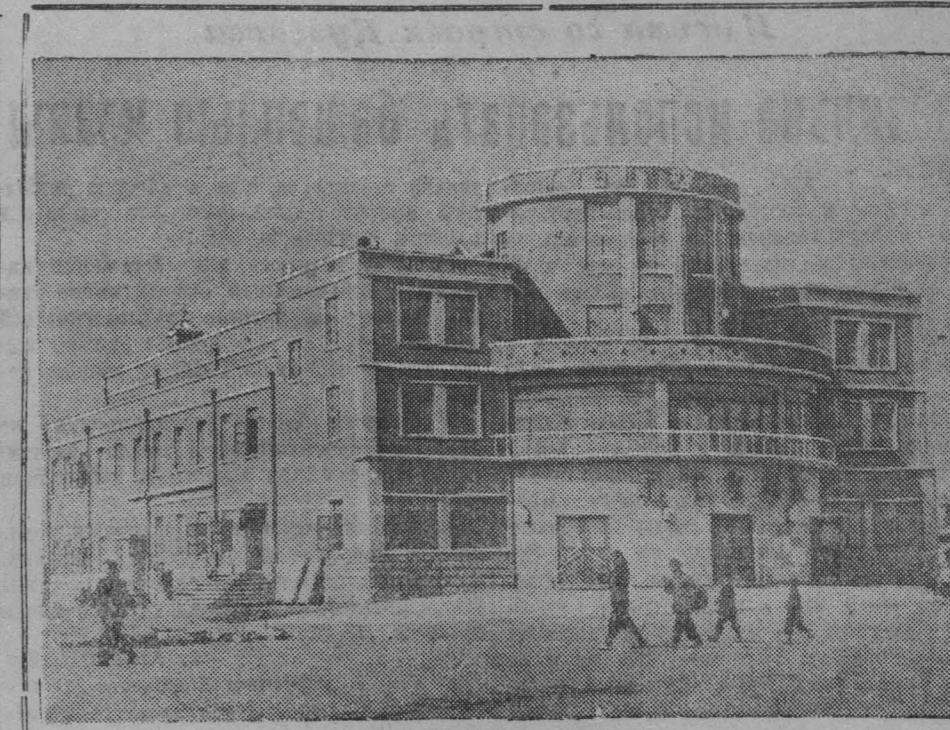
Правительство Китайской народной республики всемерно содействует развитию искусства в стране. Премьер Государственного административного совета Центрального народного правительства Китая Чжоу Энь-лай пишет: «Молодое киноискусство народного Китая, быстро вытеснив с экранов американские фильмы, завоевало значительный успех среди широких народных масс и постепенно проникает в воинские части, на заводы и в деревню». В стране создаются новые фильмы, строятся новые кинотеатры. На снимке: новый кинотеатр в городе Цзиньчжоу.

Итальянский делегат Донини от имени своей делегации предложил создать на конгрессе Всемирный совет мира — постоянную организацию в составе представителей более 80 государств, которые уже действуют совместно ради достижения общей цели. Как указал Донини, состав этого совета сейчас не должен быть слишком обширным, с тем, чтобы в дальнейшем предоставить возможность присоединиться к нему всем государствам и организациям, которые не представлены на нынешнем конгрессе.