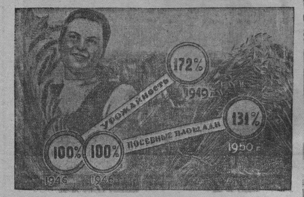
Рост посевных площадей и повышение урожайности.

В колхозной деревне Кузбасса партия небывалой трудовой и политической подъем. Пабиратели — колхозники, работники МТС, совхозов и специалисты сельского хозяйства — встретили 17 декабря, день выборов в местные Советы, новыми трудовыми успехами во славу любимой Родины.