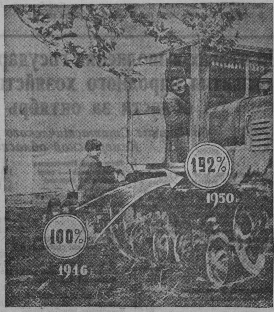
Увеличение мощности тракторного парка.

Несколько тысяч прудов и водоемов, все больше и больше становится колхозов, освоивших травянолуговые севообороты. Грандиозный размах строительства гидростанций на Волге, Аму-Дарье и Днепре, сооружение каналов в Туркмении, Крыму и на Украине, новая система орошения вызовут еще более мощный подъем социалистического земледелия и животноводства, приведут к созданию изобилия продуктов в нашей стране.