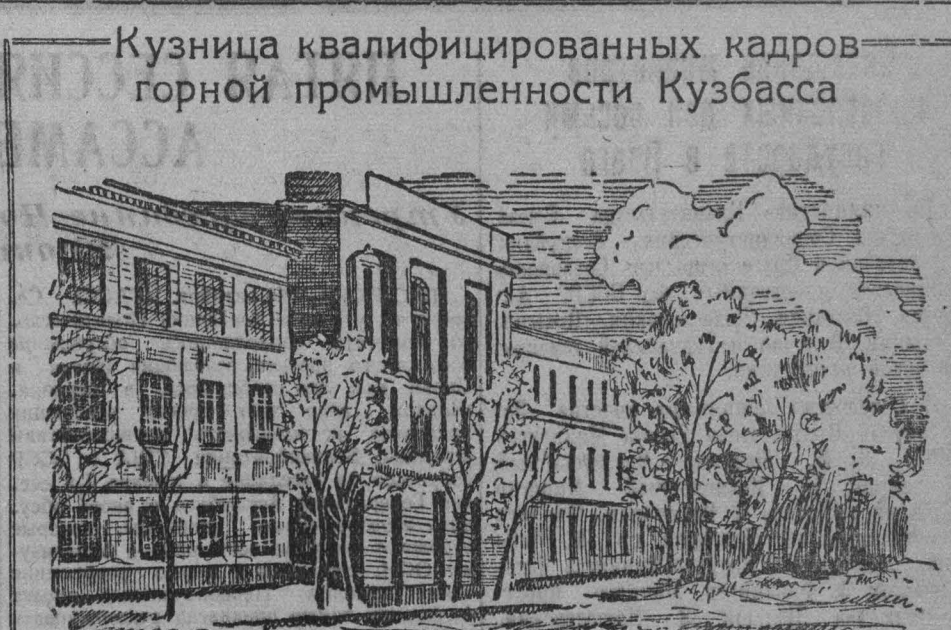
Кузница квалифицированных кадров горной промышленности Кузбасса

За летний сезон в пионерских лагерях отдохнуло 2.138 детей металлургов.