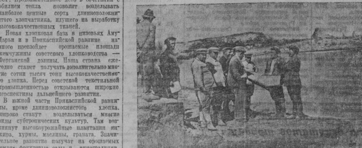
Кара-Калпакская АССР. Тахта-Таш. Здесь, на реке Аму-Дарья, будет воздвигнута плотина с мощной гидроэлектростанцией.

В этот день на шахте идет напряженная борьба за быстрое завершение годового плана угледобычи.