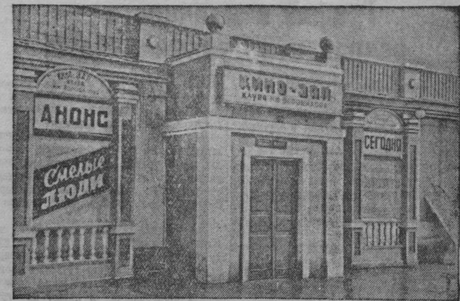
Клуб имени Ворошилова в Прокопьевске реконструируется и капитально ремонтируется. Зал клуба и сцена расширяются и будут приспособлены для концертных и театральных постановок. Трест «Прокопьевскуголь» минушним летом выстроил в поселке Березовая Роща новое здание кинозала клуба, которое уже сдано в эксплуатацию. На снимке: новое здание кинозала клуба имени Ворошилова.

Как сообщает газета «Юманите», 24 сентября в городе Безансон состоялся массовый митинг протеста против наглой вылазки фашистов.