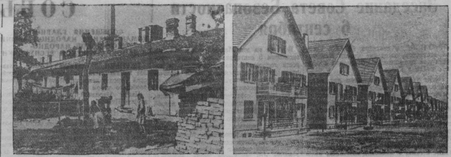
В старой Болгарии рабочие жили в неблагоустроенных домах, в тесных конурах. В Болгарской народной республике создается большое жилищное строительство. Сооружаются новые просторные и светлые дома. На снимках: жилище — старое жилище рабочих, справа — дома, построенные в квартале «Красная поляна» в Софии.