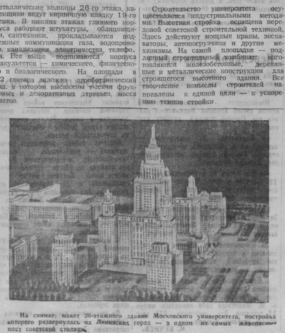
На снимке: макет 26-этажного здания Московского университета, постройка которого развернулась на Ленинских горах — в одном из самых живописных мест советской столицы.

На монументально сделанной Доске почта строительства золотыми буквами отмечены иель дией, остающиеся до конца строительства здания Московского государственного университета. «Работать строго по сучоному графику!» — призывает лозунг на Доске почта. — Придется уже менее пятисот дней до окончания стройки. Строительство идет потоком: везд за монтажниками везд поднимаются электросварщики, арматурщики, штукатуры, опалубщики, бетонщики, каменщики, плотники, сантехники, облицовщики. Никто не может отставать. Остат — значит выбиться из графика, который является нерушимым законом высотной стройки.