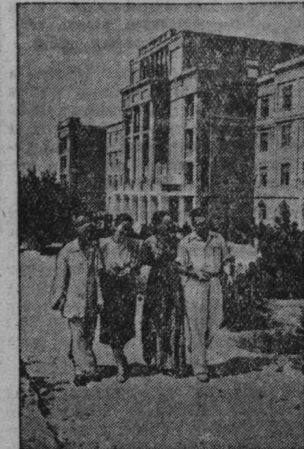
Азербайджанская ССР. В селении Бильга на берегу Каспийского моря в этом году открылся новый дом отдыха для бакинских нефтяников. Здесь уже побывало 700 человек. На снимке: в парке нового дома отдыха.