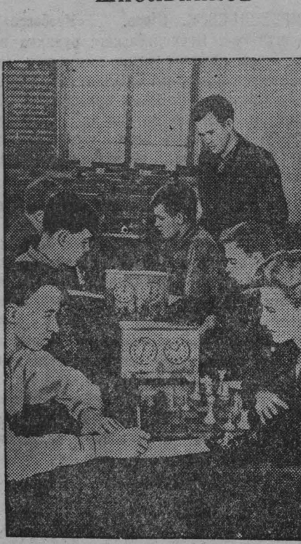
Закончился проходивший в г. Кемерово с 13 по 20 августа 1-й областной шахматный турнир школьников.

Турнир прошел в напряженной борьбе. Ни одному участнику не удалось избежать поражений. Соревнование показало неплохую подготовку большинства участников, хорошее знание теории шахматной игры.