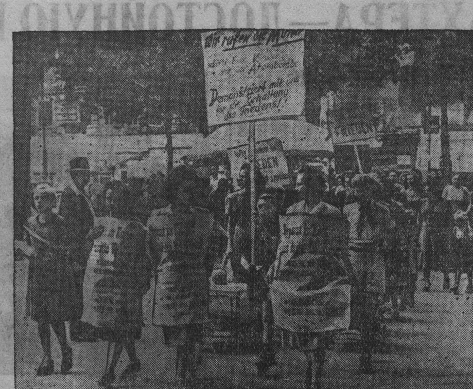
Западная Германия. Во Франкфурте-на-Майне состоялась демонстрация женщин в защиту мира. Женщины вели за руку детей, многие везли перед собой колесики.

На снимке: демонстрация женщин и детей во Франкфурте-на-Майне. На плакатах написано: «Прекратите войну в Корее!» «Мы хотим мира!» Дети несут плакат с надписью: «Мы не хотим сидеть в сырых убежищах, мы хотим строить домики из песка».