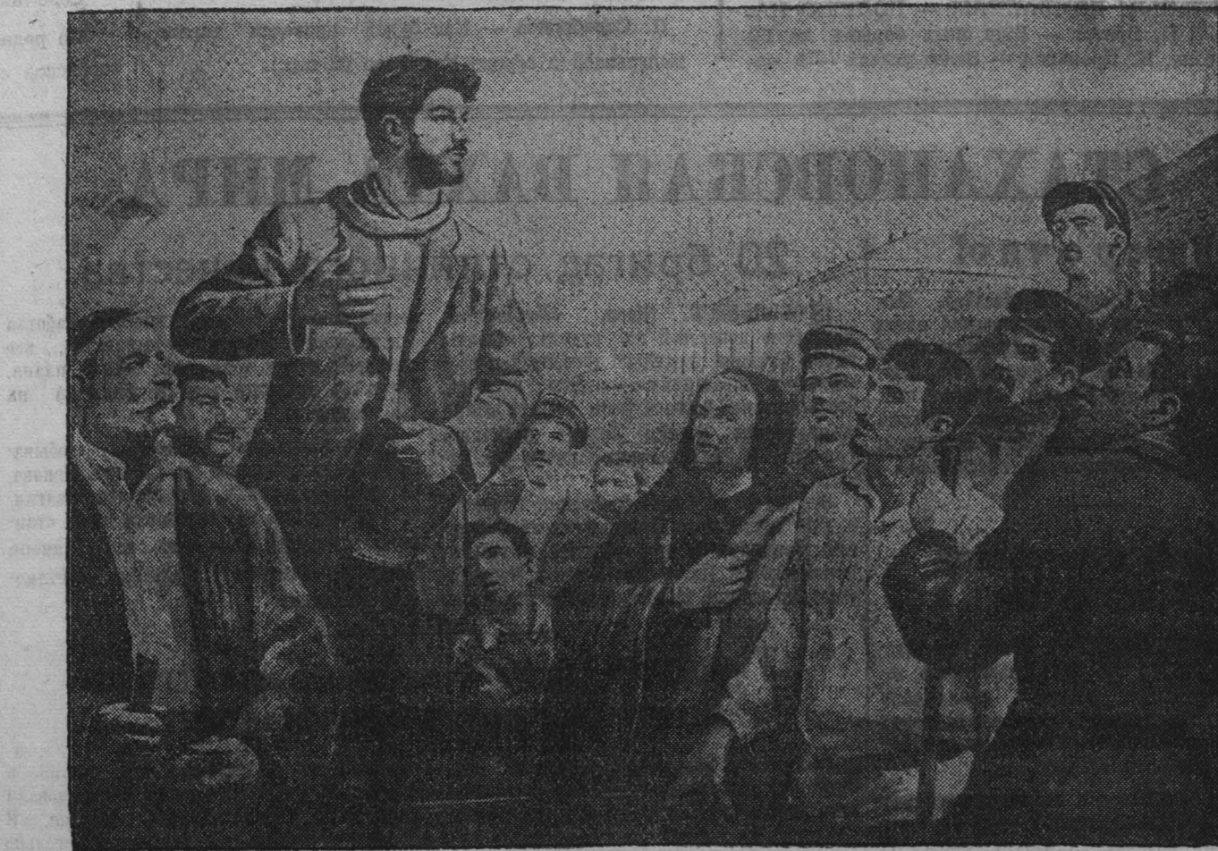
«Выступление И. В. Сталина на рабочем собрании в Тбилиси».

К 9 часам утра забастовка полностью охватила тифлиссские Главные железнодорожные мастерские и депо. Администрация не замедлила принять меры. Были вызваны войсковые части, причислено несколько сотен полицейских, но им было трудно устоять против гнева рабочих, двинувшихся по улицам города.