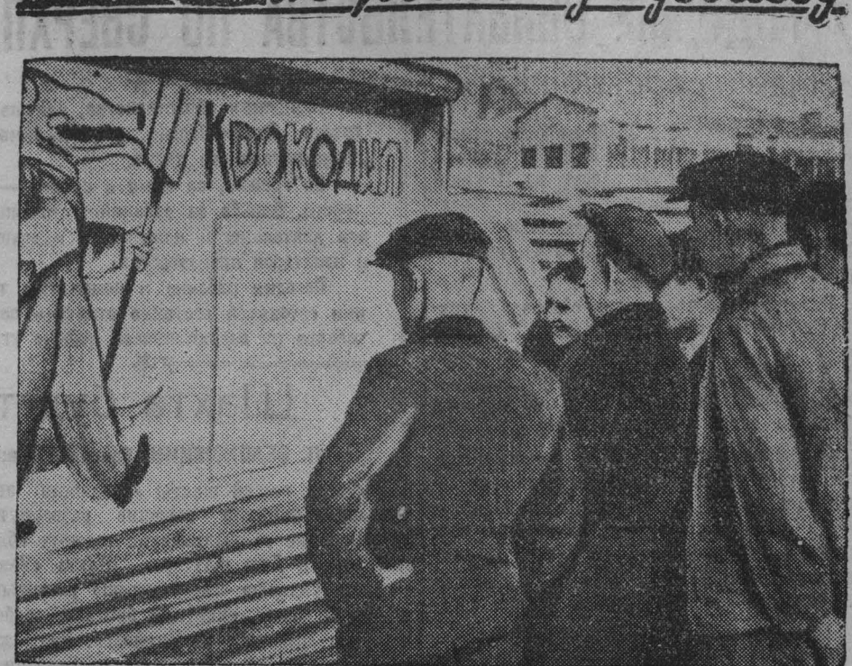
Большим успехом в коллективе Прокопьевского механического завода пользуется регулярная выходящая сатирическая стенная газета «Крокодил». На снимке: у свежего номера заводского «Крокодила».