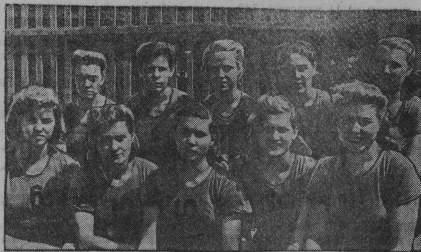
На снимках: баскетболисты гор. Сталинска. Слева — женская команда ДСО «Металлург», занявшая 2-е место в зональном розыгрыше первенства РСФСР. Справа — встреча мужских команд Сталинска и Новосибирска.

После соревнований состоится футбольный матч на первенство области по футболу между командами тайгинского «Локомотива» и анжеро-судженского «Шахтера».