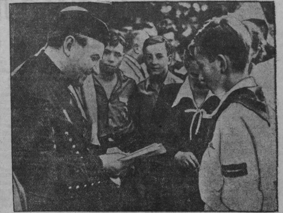
Чехословакия. Недавно президент Республики К. Готвальд в своей легкой резиденции в Ланах принял учеников шахтерских школ страны. Будущие горняки дали слово президенту — хорошо учиться и стать отличными мастерами своего дела. На снимке: президент К. Готвальд, одетый в традиционную шахтерскую форму, беседует с учениками шахтерских школ.