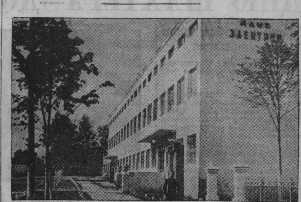
Чемпионы. Клуб энергетиков, в котором проходили соревнования шахматистов и шашкистов на кубок РСФСР.