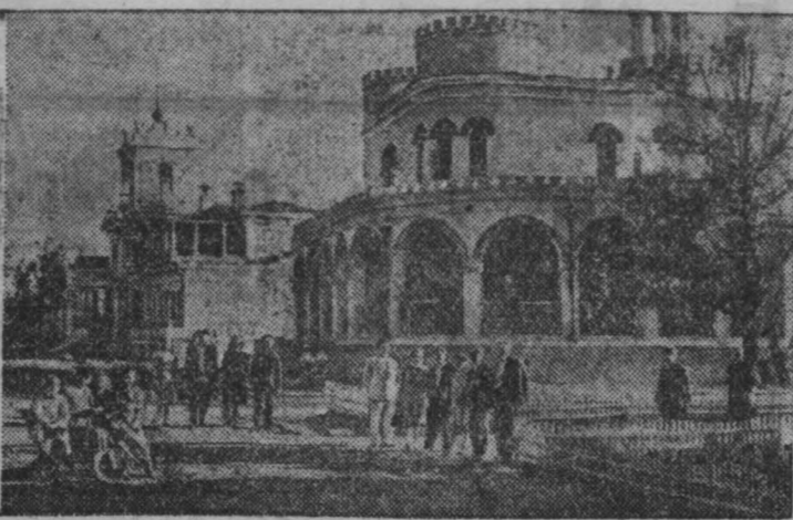
В живописной местности на берегу Волги недалеко от г. Кубышева расположены санатории ВЦСПС. Здесь продвигают свой отпуск тысячи трудящихся. На снимке: на главной аллее санатория № 1 имени Чкалова.