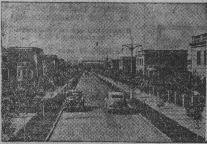
Украинская ССР. Город Ворошиловск в социалистическом соревновании за лучшее выполнение плана по благоустройству и жилищному строительству занимает одно из первых мест Ворошиловградской области. Недавно строители сдали в эксплуатацию новый квартал на Социалистической улице. На снимке: Социалистическая улица в Ворошиловске.