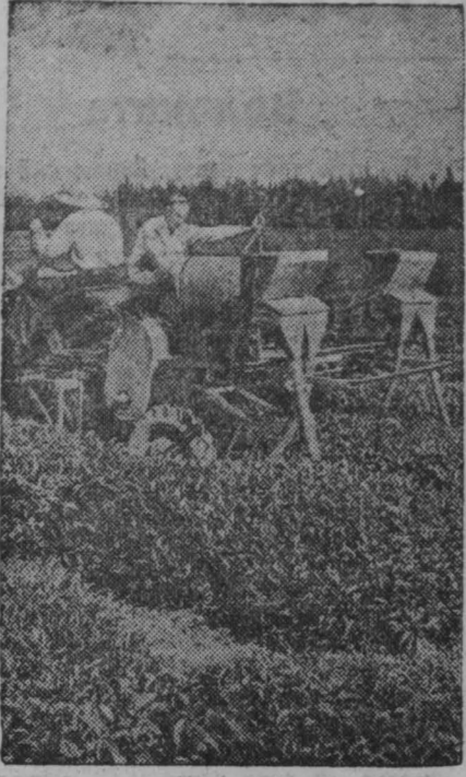
Грузинская ССР. В Лайтурском чайном совхозе имени Кирова проведены испытания чаеферомочной самоходной универсальной машины конструкции Всесоюзного института опытного сельскохозяйственного машиностроения. Новая машина выполняет четыре операции: вносит туковые удобрения, рыхлит междурядья, производит подрезку чайных кустов и собирает и бункер чайный лист.