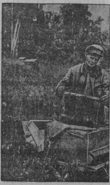
На пасеке колхоза «Красная звезда»...

Лазарева, Рыжковского, Бондаря (Кузнецкий металлургический комбинат), Усачева, Мишукова (трест «Сталинепромстрой»), Шермана, Сверкова (завод имени Молотова).