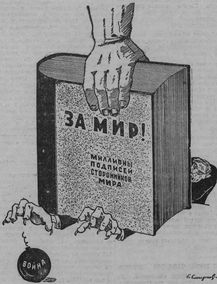
Рис. Евг. Смирнова.

Фронт борцов за мир растет и крепнет с каждым днем. Уже свыше 100 миллионов людей доброй воли поставили свои подписи под Стокгольмским воззванием.