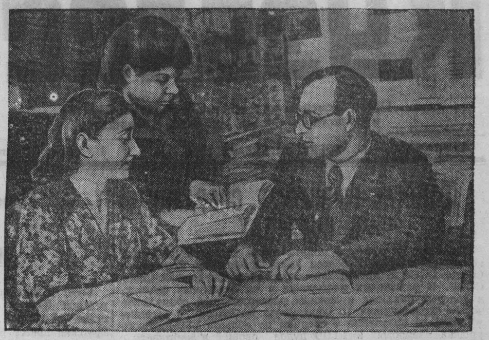
Партийные организации города Сталинка развернули широкую агитационно-массовую работу по месту жительства трудящихся. Сотни партийных и непартийных агитаторов ведут политическую работу в массах, разъясняют «Положение о выборах в Верховный Совет СССР».

БАКУ. 16 января. (ТАСС). Сегодня во Дворце культуры имени Сталина пришли рабочие, инженерно-технические работники и служащие переводного треста «Сталиннефть», чтобы обсудить вопрос о выдвижении кандидата в состав Центральной избирательной комиссии по выборам в Верховный Совет СССР.