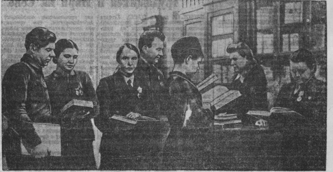
«День сельской интеллигенции» Кемеровского сельского района. В перерыве между заседаниями.