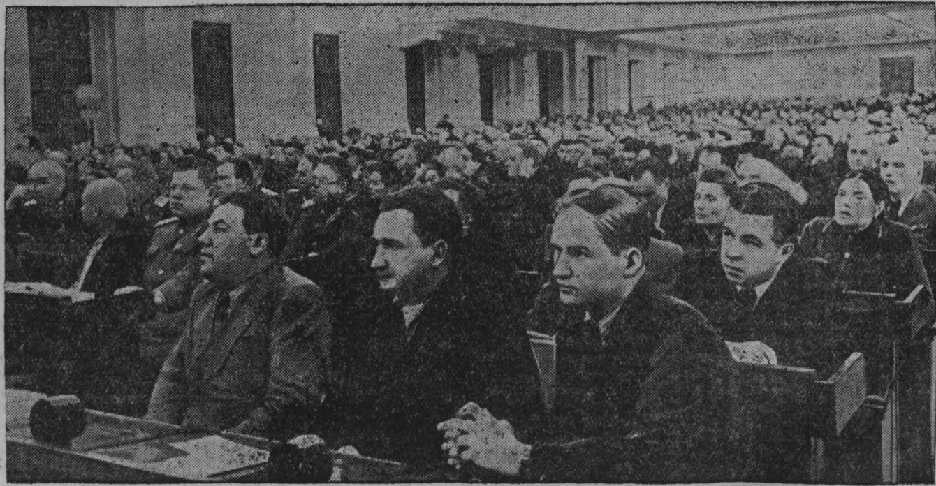
Москва. Первая сессия Верховного Совета СССР. Совместное заседание Совета Союза и Совета Национальностей в Большом Кремлевском дворце.

Тов. Ботвинник прочтет в Воронеже ряд лекций о шахматном искусстве в СССР.