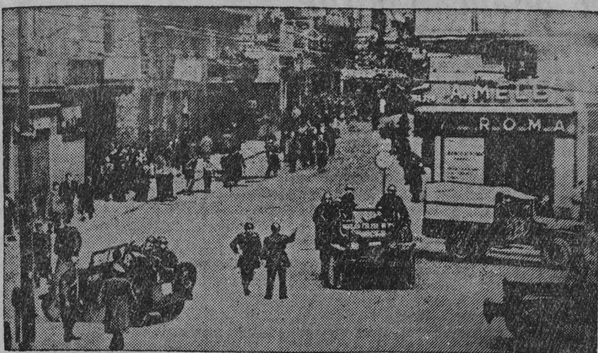
Италия. Большинство итальянского народа терпит жестокие лишения и нужду. Миллионы безработных и полубезработных не могут найти применения своим силам. Правительство де Гаспери проводит реакционную политику, подчиняющую Италию американским колонизаторам. Дороговизна растет, снижается заработная плата. Беспощадно расправляется с бастующими рабочими полиция Мельбы, вооруженная американским оружием.

войск в Германии, с чем советские оккупационные власти не могут мириться. Считаю необходимым обратить Ваше внимание на то, что шлюзы Шпандау, Шарлоттенбург и Плетцензе являются частью внутренних водных путей Германской демократической республики и находятся в ведении ее генеральной дирекции судоходства. Поэтому вышеуказанные действия западноберлинских чиновников и полицейских являются грубым вмешательством в эксплуатацию внутренних водных путей Германской демократической республики.