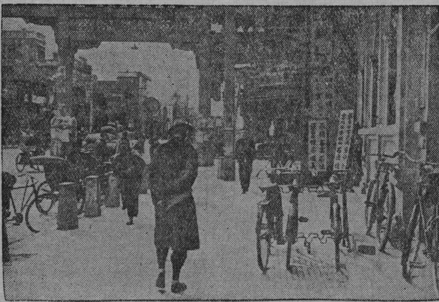
Китайская Народная республика. На улицах Пекина

подготовиться к тому, чтобы широко открыть двери для рабочих и крестьян и постепенно научиться планировать свою работу в соответствии с нуждами национальной реконструкции.