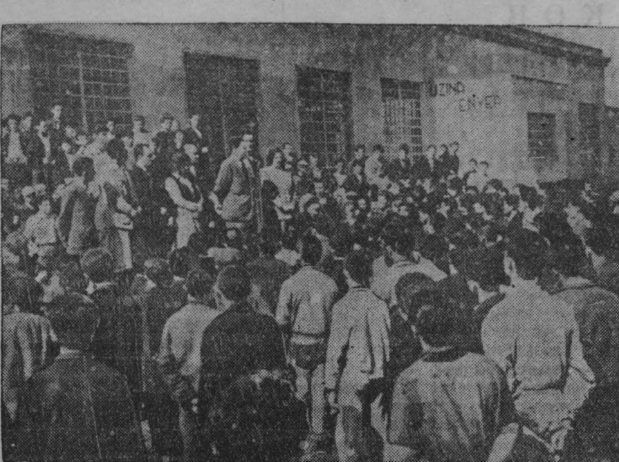
Албанцы в промышленных центрах и деревнях, в учреждениях и школах страны развернула кампания по сбору подписей под воззванием Стокгольмской сессии Постоянного комитета Всемирного конгресса сторонников мира.

Албанцы в промышленных центрах и деревнях, в учреждениях и школах страны развернула кампания по сбору подписей под воззванием Стокгольмской сессии Постоянного комитета Всемирного конгресса сторонников мира. Албанский народ присоединяется к требованию о безусловном запрещении атомного оружия и об объявлении военным преступником правительства, которое первым применит это оружие.