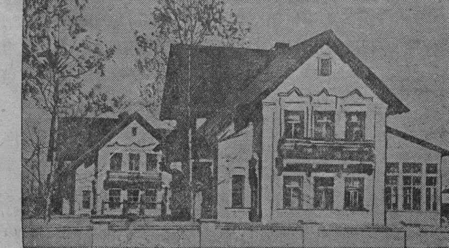
Лучшие молодые стахановцы-металлурги Кузнецкого комбината поселины в новые благоустроенные коттеджи. На снимке: вид на коттеджи.