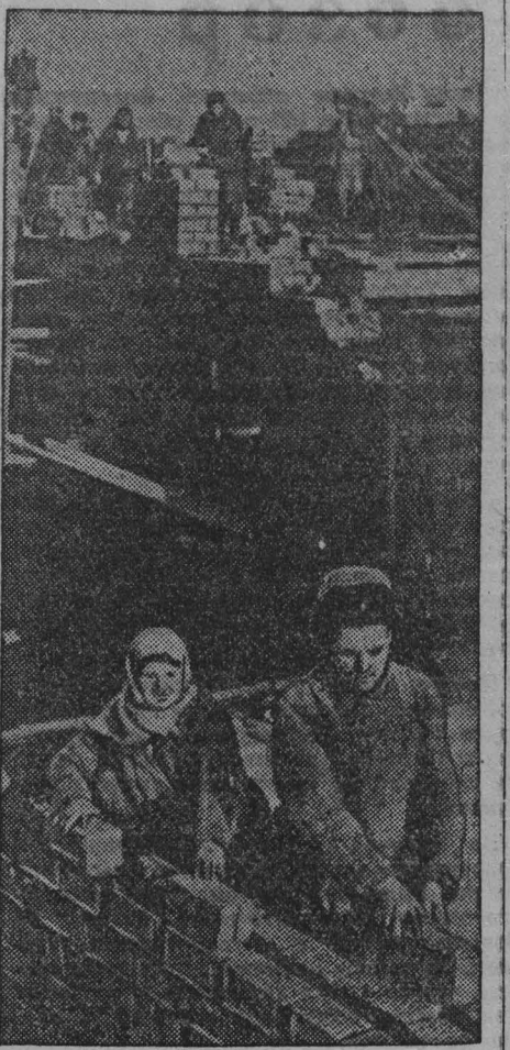
На строительстве одного из жилых домов в г. Кемерово.