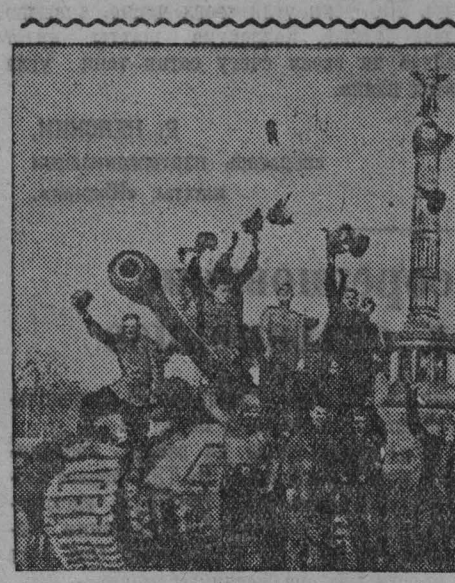
2 мая 1945 года части Советской Армии полностью овладели столицей Германии — Берлином. На снимке: советские танкисты на аллее Победы в Берлине 2 мая 1945 года.